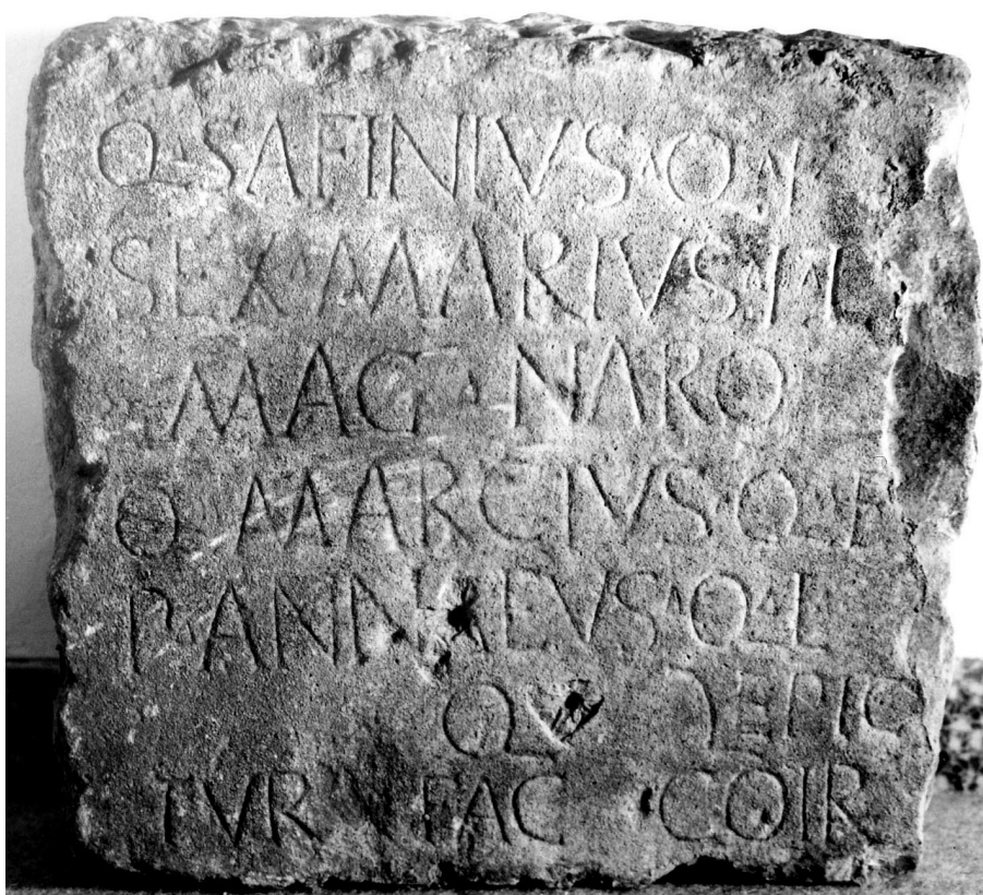
Lám. I - CIL 1820 = 8423.