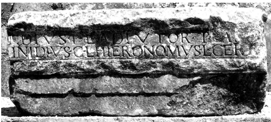
Lám. IV - CIL III, 8446.