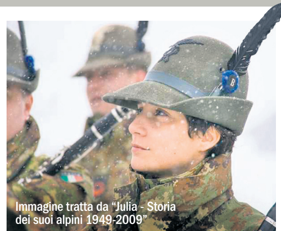
Immagine tratta da "Julia - Storia dei suoi alpini 1949-2009"

ni, ma soprattutto quella di uomini e donne animati da coraggio, volontà e impegno, che hanno condiviso paure, sacrifici e momenti di gloria. Attraverso le 270 immagini che compongono il libro, accompagnati dai muli o equipaggiati con le più moderne tecnologie, emergono i sentimenti che muovono gli alpini da sessant'anni a questa parte. La vita di migliaia di persone, unite nella comunità degli alpini scorre nelle pagine di "Julia - Storia dei suoi alpini 1949-2009" e rimane, come punto fermo, nel cuore di tutti coloro che amano le penne nere.